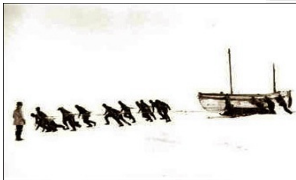
Shackleton's crew on his exploration of the South Pole

Focus - Quale sfida lancia un cambiamento kaizen rispetto alle variabili umane in gioco? Come devono essere attivate le dinamiche motivazionali ?