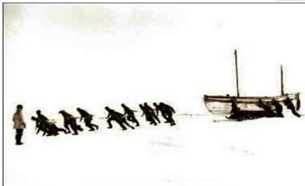
Shackleton's crew on his exploration of the South Pole

Focus - Quale sfida lancia un cambiamento kaizen rispetto alle variabili umane in gioco? Come devono essere attivate le dinamiche motivazionali ?